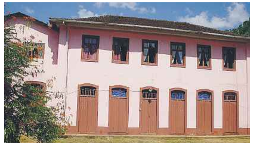
Das älteste Haus des Ortes, in dem früher die Handelsfirma Vervloet ihren Sitz hatte, die ein wahres Kaffeeimperium regierte