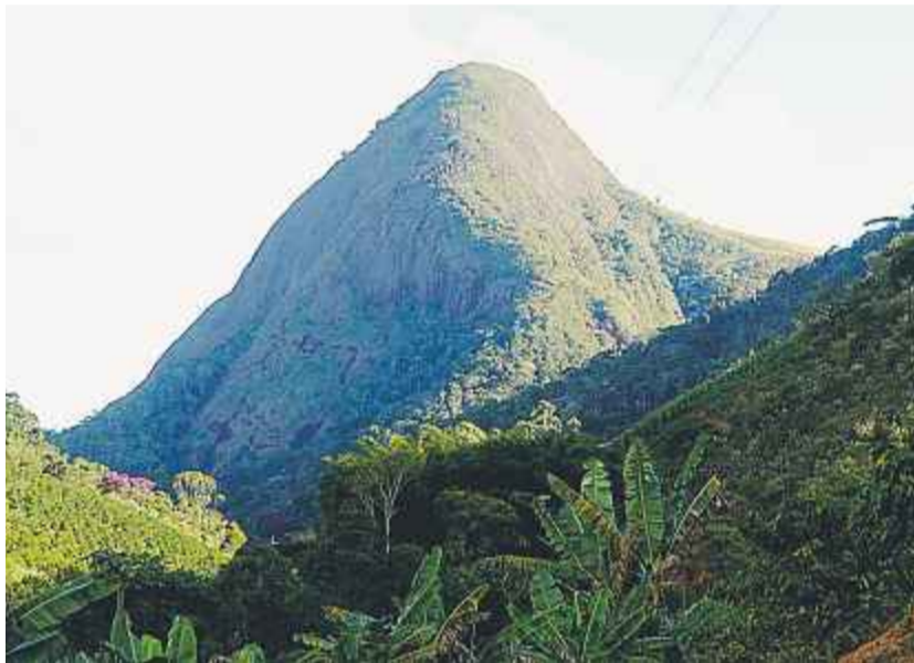
Weithin sichtbar ist der „Pedra Preta“, der Schwarze Stein, der mit seinen fast 2.000 Metern Höhe einer der Hauptsehenswürdigkeiten der Region ist

Anstatt selbst Projekte in Angriff zu nehmen wartet man lieber auf die Hilfe aus Europa. Der Kaffee, das