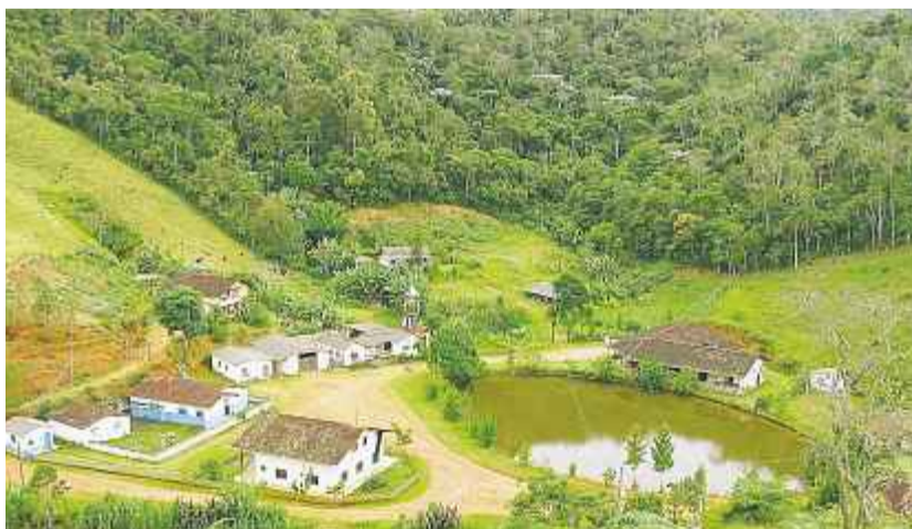
Die Mehrheit der Bewohner der „Colonia Tirol“ sind Nachkommen von Einwanderern aus dem Stubaital in Südtirol