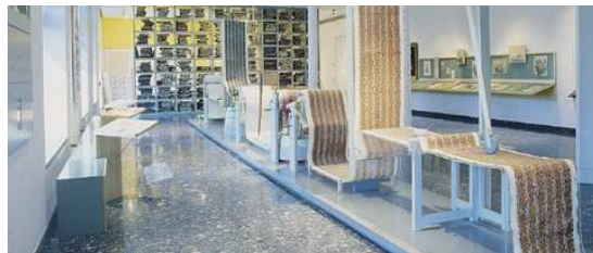
Musée d'Impressions sur Etoffes

Petit déjeuner à l'hôtel Départ avec votre autocar vers Mulhouse 10h00 Visite guidée du Musée d'Impression sur Etoffes par un guide du Musée : il conserve aujourd'hui plus de 6 millions de motifs, faisant de lui le plus important centre d'images textiles au monde. Les stylistes du monde entier viennent y chercher l'inspiration. Outre les livres d'échantillon, le musée conserve près de 50 000 documents textiles : métrages, dessus de lit, foulards, châles... Déjeuner traditionnel dans un restaurant Poursuite vers Rixheim Visite guidée du Musée du Papier Peint par un guide du Musée : Grâce à ses collections sans équivalent, mais aussi des machines, des archives, le Musée du Papier Peint vous permet de revivre son histoire et de découvrir avec un œil neuf un monde que, peut-être, vous croyez connaître. La Manufacture Zuber et Cie a apporté au musée quelque 130 000 documents, témoin de sa production de 1800 à nos jours. Ainsi le Musée du Papier Peint est le seul au monde à présenter à côté du produit fini le matériel qui en a permis la réalisation et les archives qui témoignent de sa commercialisation à travers le monde. Retour à votre hôtel Dîner à l'hôtel dans la cadre de votre demi-pension Nuit à l'hôtel