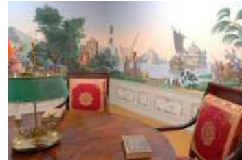
Musée du Papier Peint