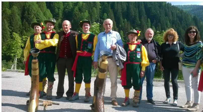
Ausklang des 6. Internationalen Gottscheer Treffens in Bad Aussee auf der Blaa-Alm